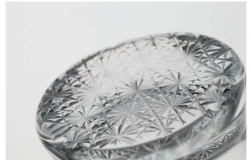
杜康の玻璃 菊繫文 10,000円 (税抜価格)