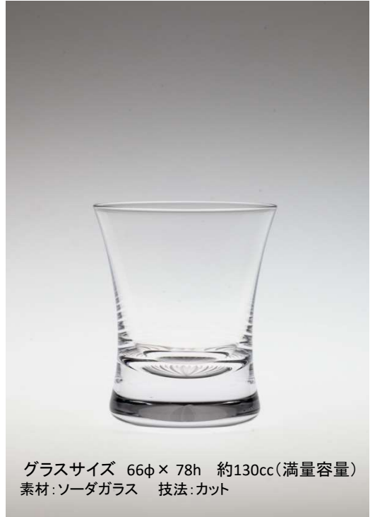
グラスサイズ 66φ × 78h 約130cc(満量容量) 素材:ソーダガラス 技法:カット