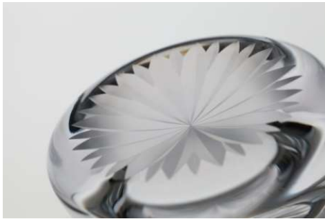
杜康の玻璃 菊文 5,000円 (税抜価格)