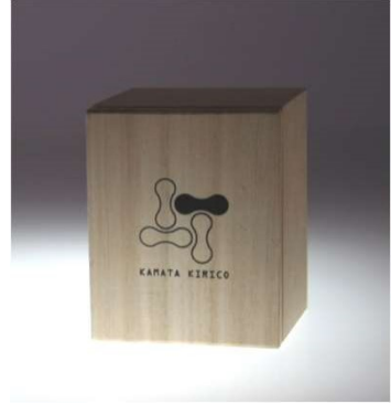
桐箱入り ペアセットの桐箱もあります