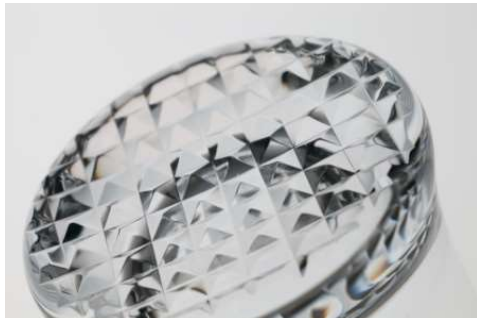
杜康の玻璃 魚子文 8,000円 (税抜価格)