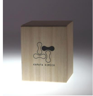
桐箱入り ペアセットの桐箱もあります