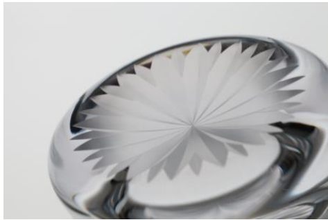
杜康の玻璃 菊文 5,000円 (税抜価格)