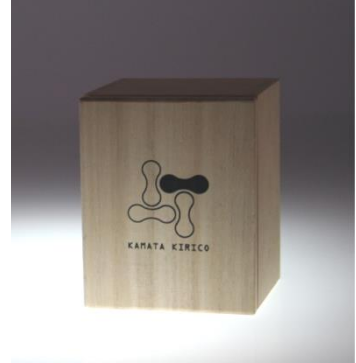
桐箱入り ペアセットの桐箱もあります