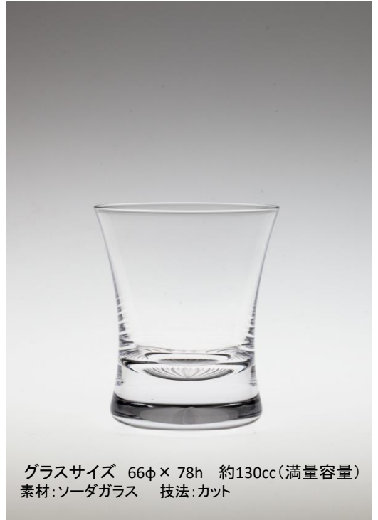
グラスサイズ 66φ × 78h 約130cc(満量容量) 素材:ソーダガラス 技法:カット