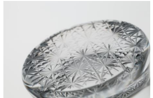
杜康の玻璃 菊繫文 10,000円 (税抜価格)