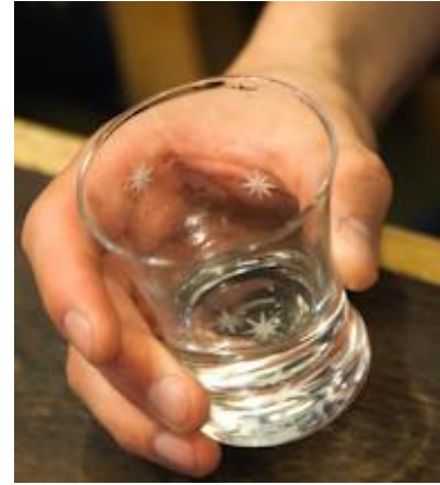
グラスの底にも 星を彫りこんでいます

北辰 1個 5,000円 (税込価格 5,500円) ペアセット 10,000円 (税込価格 11,000円)