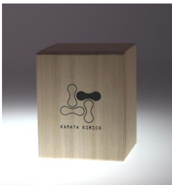
桐箱入り ペアセットの桐箱もあります