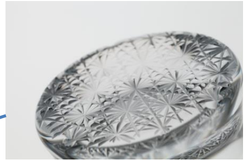
グラスの底に菊繋ぎ文様を彫りこんでいます