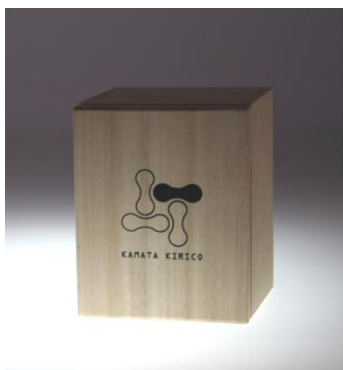
桐箱入り ペアセットの桐箱もあります