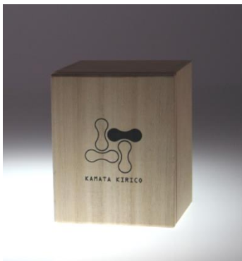
桐箱入り ペアセットの桐箱もあります