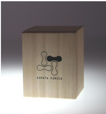
桐箱入り ペアセットの桐箱もあります