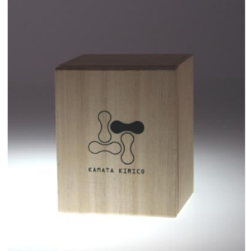
桐箱入り ペアセットの桐箱もあります